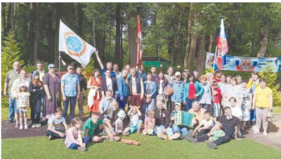
Участники «Праздника трезвости» в Демьяново.

// Игорь СМИРНОВ, председатель Клинского клуба трезвости.