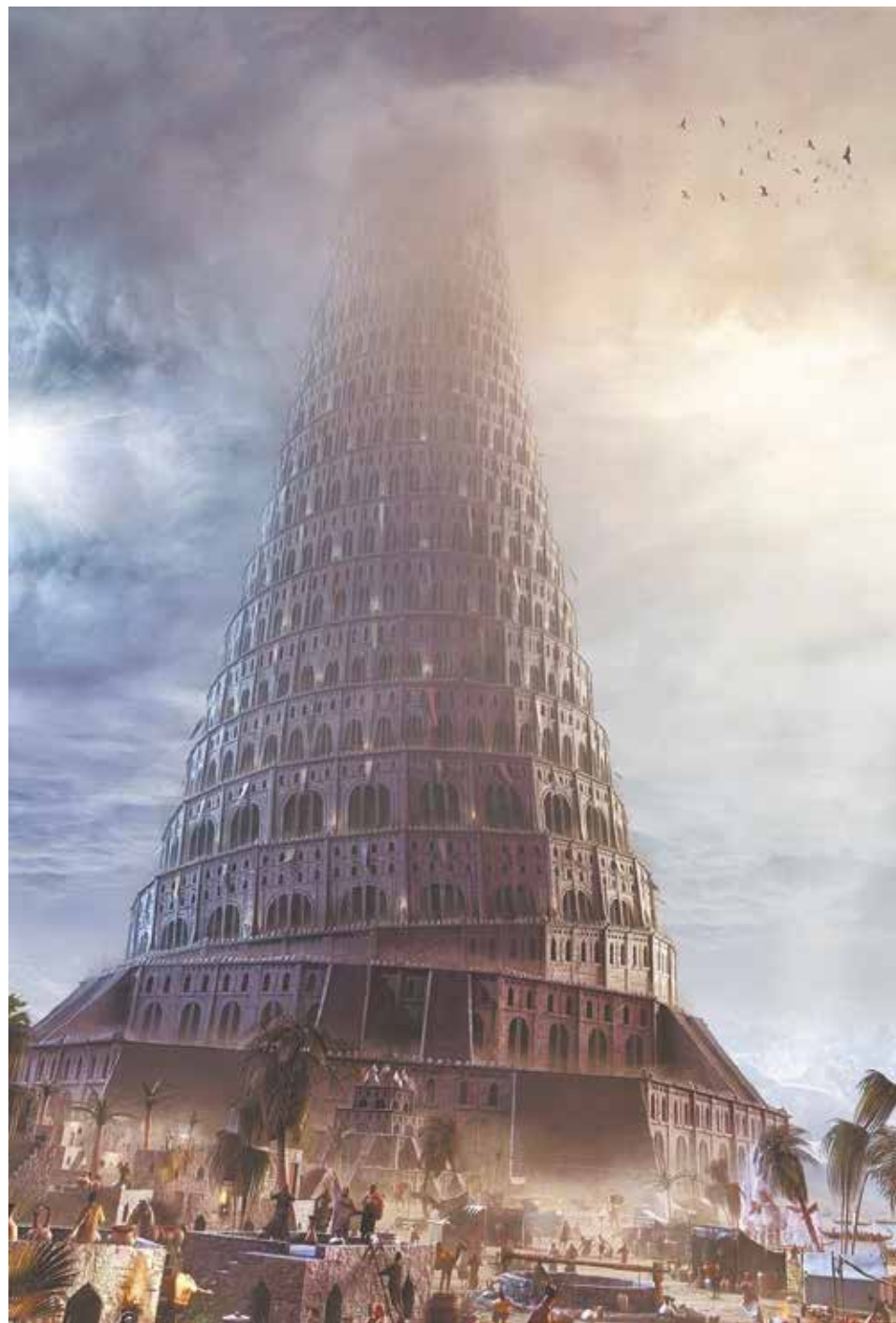
Вавилонская башня. РИСУНОК WWW.KLIKI.NET.

Но если душа человека оказывается без Бога, то происходит