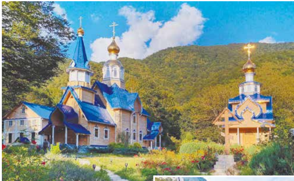
Храм в честь Усекновения главы Иоанна Предтечи в монастыре в Псху, Абхазия, наше время.

На этом видение вдруг закончилось, спящий в ночной темноте и тишине город пришел в свое прежнее состояние, никакого лязга, никаких танков, никаких солдат – всё стало, как было.