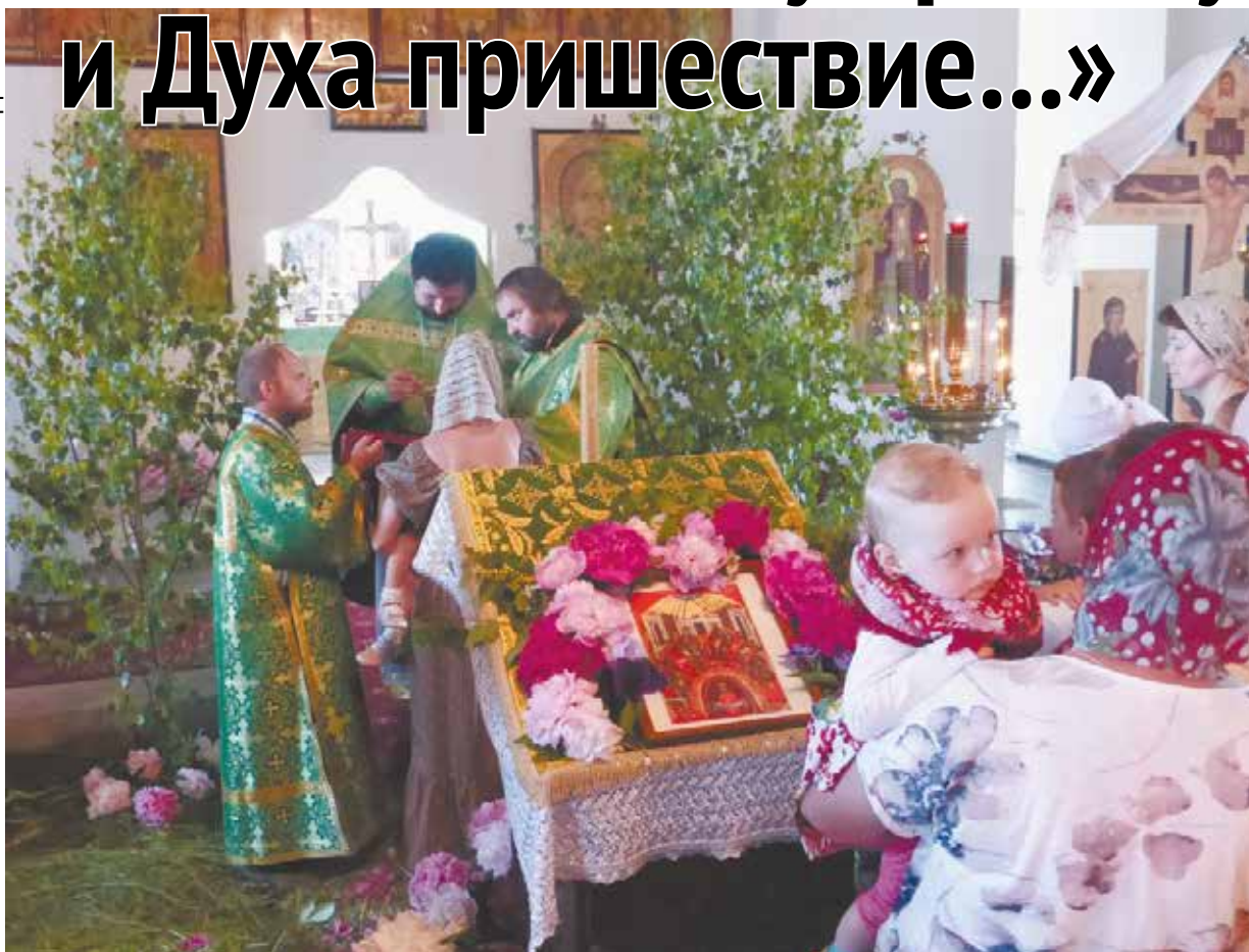
Праздник Святой Троицы в Троицком храме с. Новошапова Клинского благочиния.