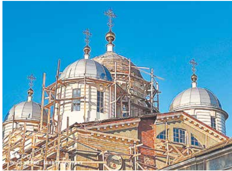
Восстанавливающийся Троицкий собор г. Клина.

На глазах хорошеет наш главный городской храм – Троицкий собор. Клинчане внимательно наблюдают за производимыми работами и ждут их окончания.