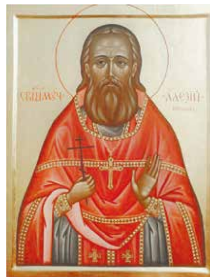
Икона священномученика Алексея Селинского.

Протоиерея Алексея Воробьева причислили к лику святых на юбилейном Архиерейском Соборе в 2000 году.