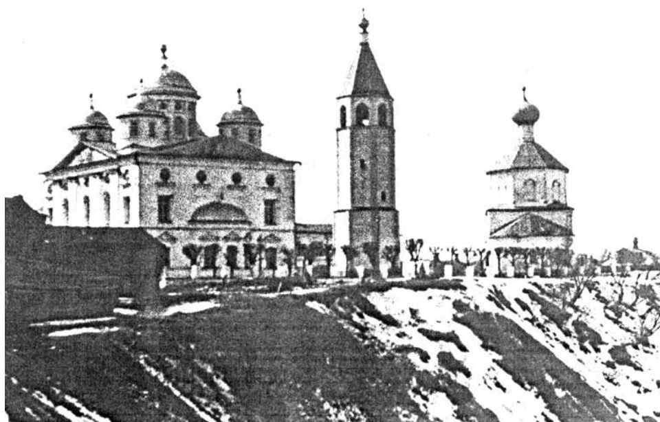
Троицкий собор, вид со стороны д. Праслово. ФОТО XIX ВЕКА.