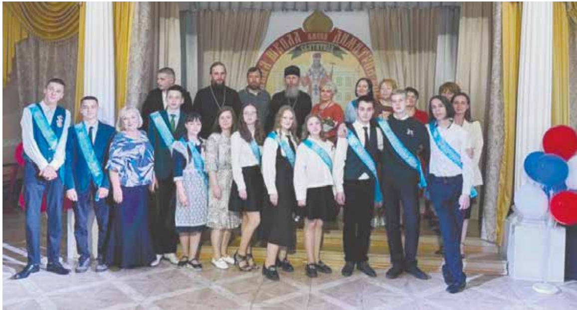
Выпускники 2024 школы им. Димитрия Ростовского с наставниками.

школы в Демьяново стало событием для всего прихода. В дореволюционное время при